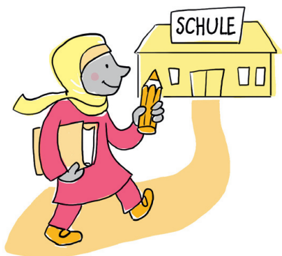
Schule = Школа

Консультационные центры по вопросам и проблемам беременности помогают женщинам и супружеским парам во время беременности и после родов. При наличии каких-либо проблем с беременностью вас проконсультируют и будут наблюдать. Кроме того, женщины, мужчины и пары могут получить здесь консультацию по вопросам сексуальности и планирования семьи, не связанным с беременностью. Такой консультационный центр есть в каждом районе федеральной земли.