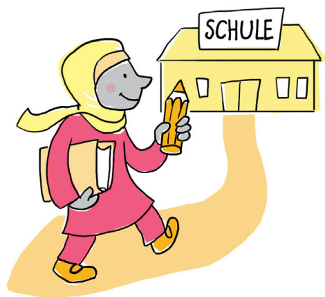
Schule = ŠKOLA

Na visokim školama u Saksoniji-Anhalt možete studirati ako imate pravo na pristup visokoškolskom obrazovanju (položenu maturu) ili sve već započeli sa studijama. U zavisnosti od toga za koji studijski smer se interesujete, obratite se akademskim službama za saradnju sa inostranstvom na visokim školama u Saksoniji-Anhalt.